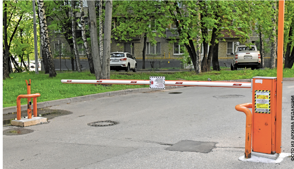
Установка ограждающих устройств может осуществляться:

Вместо результатов опроса может учитываться мнение собственников помещений в многоквартирном доме по вопросу установки ограждающего устройства, оформленное в виде решения собственников помещений в многоквартирном доме, принятого на общем собрании таких собственников помещений, проведённом в заочной форме с использованием автоматизированной информационной системы «Электронный дом», при принятии на таком общем собрании иных решений, при условии, что за установку ограждающего устройства проголосовало большинство голосов от общего числа голосов, принявших участие в таком собрании собственников помещений в многоквартирном доме.